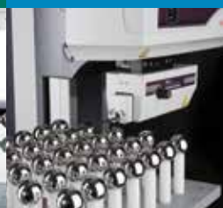
Prístroje na meranie tvaru