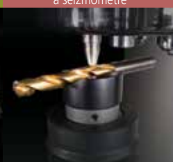
Testovacie zariadenia prístroje a seizmometre