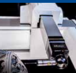
Súradnicové meracie stroje