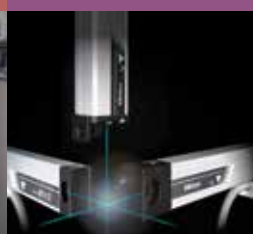
Digitálne pravítka a DRO systémy