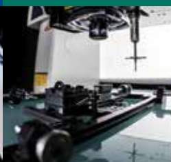
Kamerové meracie prístroje